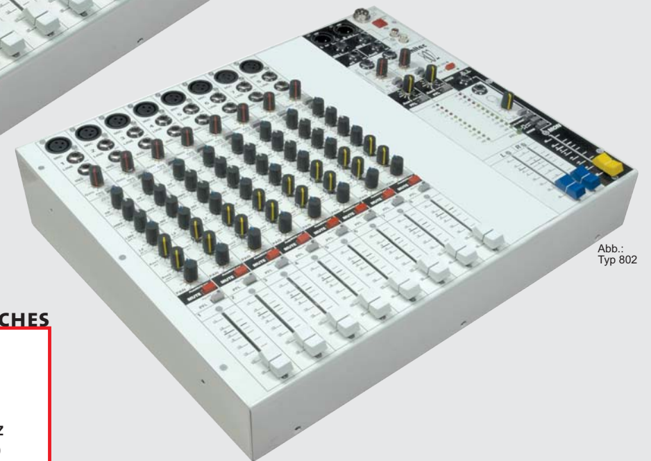
Abb.: Typ 802