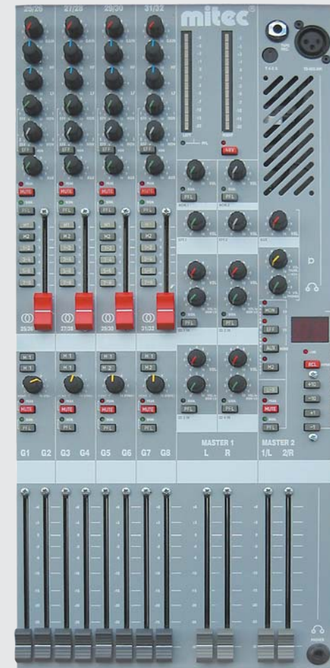
Mastersektion Performer 32

Das externe Kabelnetzteil ist mit einer robusten, verriegelbaren 4-poligen Steckverbindung ausgerüstet.