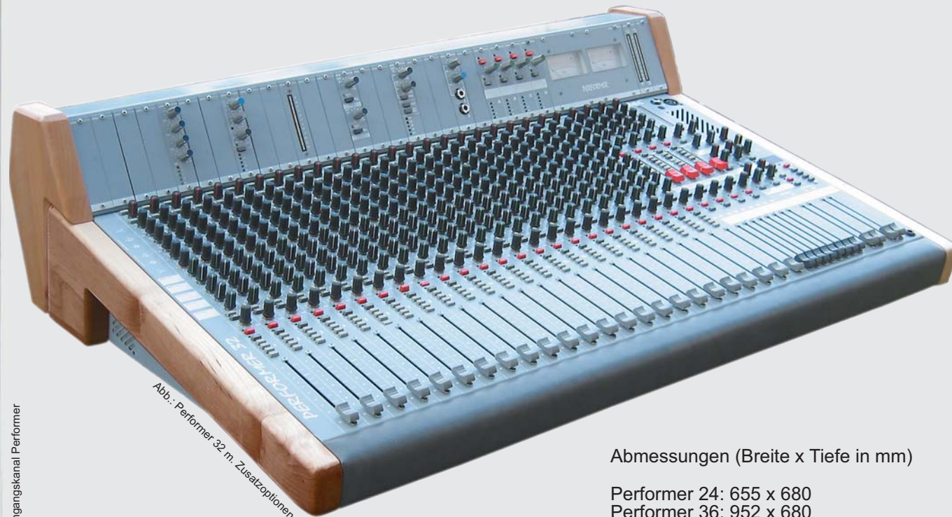
Abb.: Performer 32 m. Zusatzoptionen

PERFORMER 40: 24 x MONO-INPUTS 8 x STEREO-INPUTS 8 x SUBGROUP OUT 2 x STEREO-MASTER